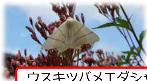
ウスキツバメエダシャク